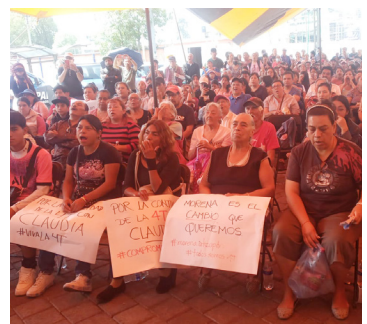
▲ Militantes guindas acordaron en asamblea votar por Claudia Sheinbaum pero no por el expanista.