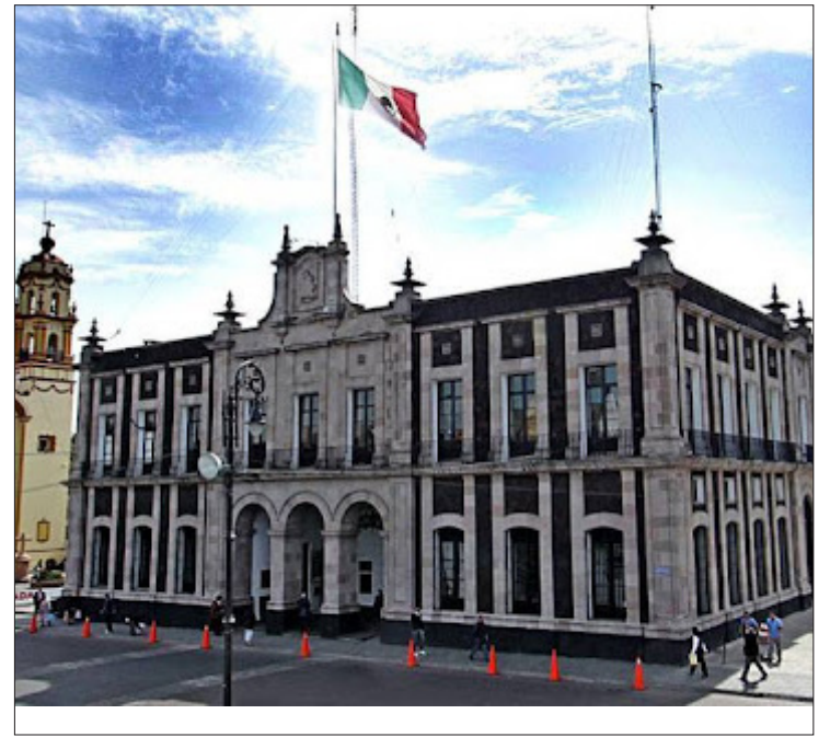
▲ Las personas que integran los juzgados estarán encargadas de conciliar y dar certeza de la correcta aplicación de la ley.

puntualizó que las personas que conforman dichos juzgados estarán encargados de conciliar y dar certeza de la correcta aplicación de la ley y ordenamien-