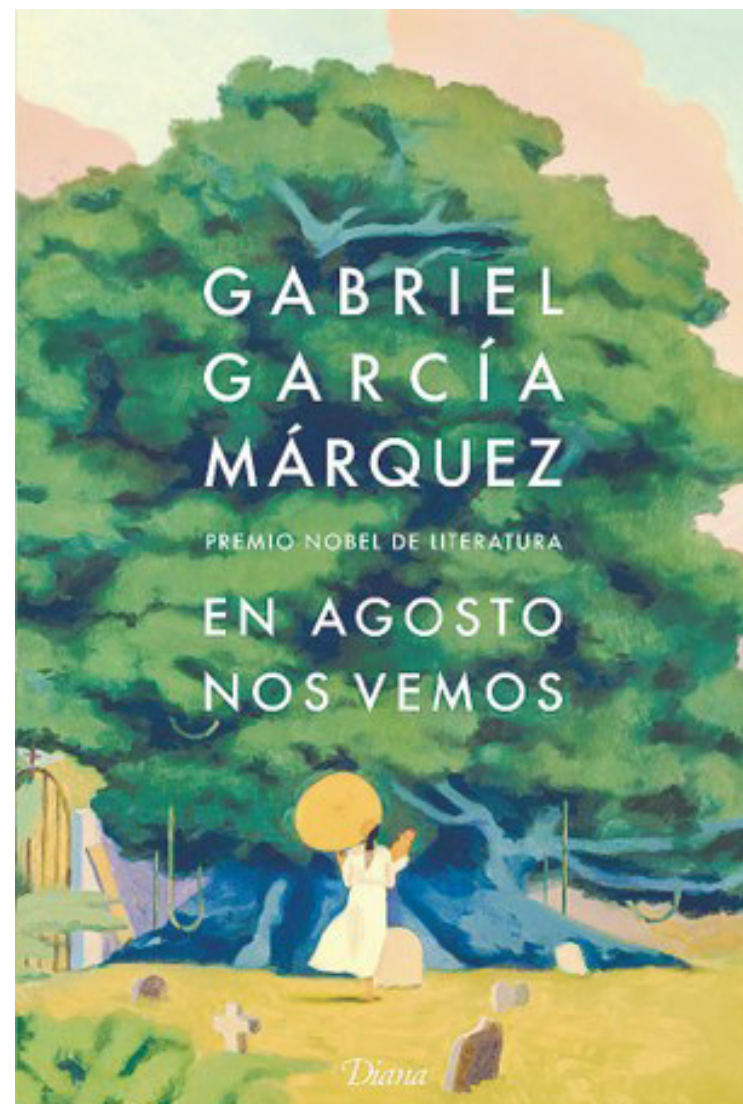
▲ Esta obra causó gran expectación entre admiradores e irritación entre quienes exigen respeto a la decisión del autor.

Ana Magdalena es hija de un maestro de piano que se desempeña como director del Conservatorio. Está casada con Domérico Amarís, un director de orquesta que viene también de una familia de músicos; “hombre de cincuenta y cuatro años, bien educado, guapo y fino”. Su matrimonio había alcanzado los veintisiete años. Se amaban desde hacía mucho. Por eso no dudó Ana Magdalena en casarse con él antes de terminar la carrera de Artes y Letras. Juntos procrearon dos hijos, un hombre y una mujer. El primero tiene ya veintidós años; la segunda, dieciocho. En estas casi tres décadas de matrimonio se había adaptado a su marido, “se hizo como él, y él la conoció tan a fondo que terminaron por ser uno solo”. Por esta razón, a su esposo le pareció sospechosa la actitud de su mujer luego del viaje más reciente a la isla donde Micaela, su suegra, había pedido ser sepultada tres días antes de su falleci-