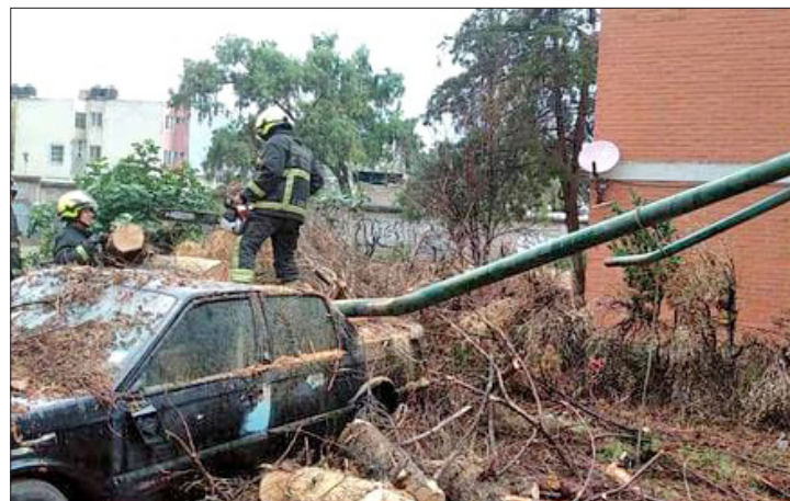
▲ En la Unidad Tepalcapa se derrumbaron tres árboles que cayeron sobre dos vehículos.

trasladado a las oficinas de la Fiscalía General de Justicia del Estado de México (FGJEM), donde se inició una carpeta de investigación en su contra por su presunta participación en delitos contra la salud.