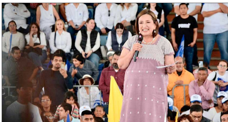
▲ La candidata de Fuerza y Corazón por México visitó San José del Cabo.

“El tema es que los mexicanos ya no le creen sus mentiras, la gente está mucho más atenta a las mentiras que dijo y va a volver a decir. Ojalá vaya, porque si no va ya tiró