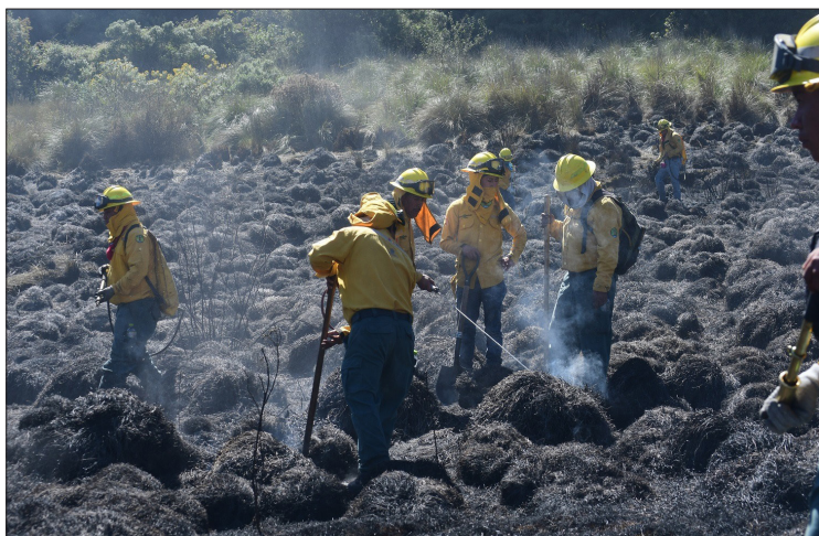
▲ La Protectora de Bosques dio a conocer el combate a estos incendios en su reporte diario.

También en Ixtapantongo, Santo Tomás de los Plátanos; Muyteje en Acambay; así como en el Cerro Cacalotepec y Rincón de López, ambos ubicados en el municipio de Tejupilco al suroeste del estado.