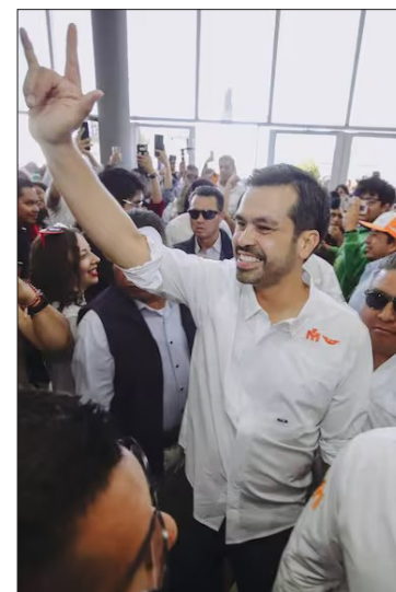
▲ Jorge Álvarez Máynez dijo que este tema lo abordará después del 2 de junio.