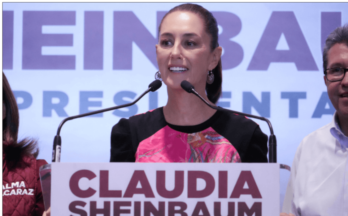
▲ Claudia Sheinbaum denunció que otorgan 9 mil pesos a través de los plásticos.

La candidata de Morena-PT-PVEM evidenció el esquema a través de la “Tarjeta Rosa”