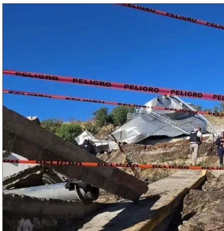
▲ En noviembre colapsó el tanque "Adolfo López Mateos" (en la imagen).

Vecinos de San Agustín Atlapulco exigen a Protección Civil estatal revisar este depósito porque podría colapsar como sucedió con otro en noviembre pasado