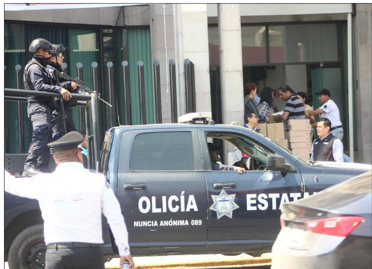
▲ La ola de violencia se concentra en la zona oriente de la entidad mexicana. Foto especial

Joaquín Rubio calificó como antidemocráticas las agresiones hacia su personal y el asesinato de un funcionario en el municipio de Axapusco