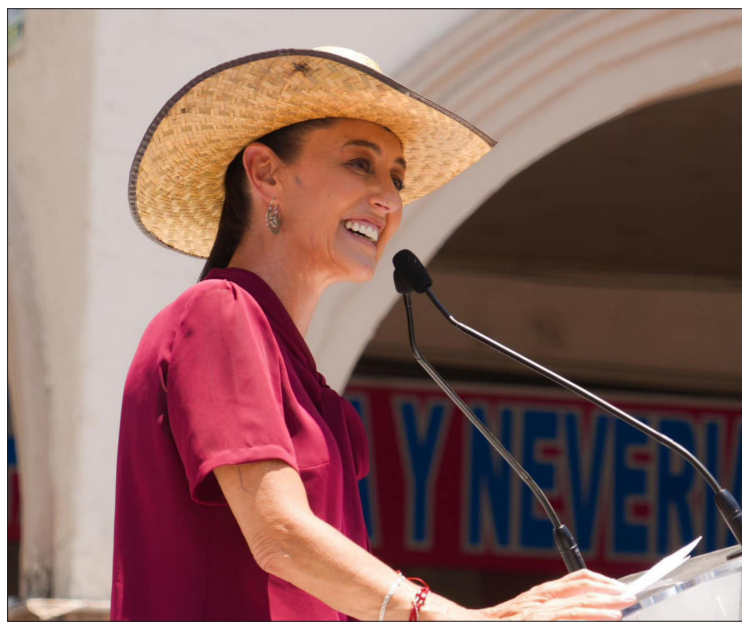
▲ La candidata a la presidencia recordó al expresidente y su lucha en la revolución mexicana.

La candidata hizo un llamado al Poder Judicial para que se responsabilice ante la inseguridad que se vive en el municipio