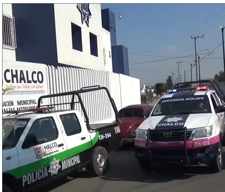
▲ El hombre de 35 años fue detenido por alterar el orden público. Foto especial

Por este hecho se inició la carpeta de investigación AME/AMC/00/MPI/400/00391/24/02, pero al momento no han avanzado las investigaciones por lo que incluso esta familia chalquense, con el apoyo de algunos amigos y vecinos, bloquearon la carretera federal México-Cuautla para exigir que se esclarezca el ca-