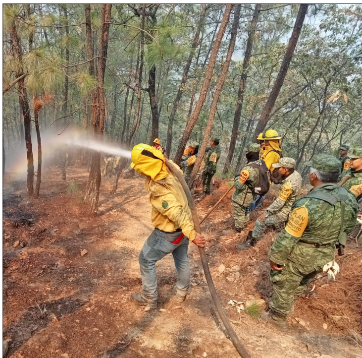
▲ Brigadistas de Probosque, Conafor, Sedena y comunitarios participaron en el combate del fuego en el Cerro de Cacalotepec y Rincón de López.

También se dio a conocer que la entidad se ubica en el primer lugar nacional de producción de flores de ornato con más de 12 mil hectáreas cultivadas anualmente; las