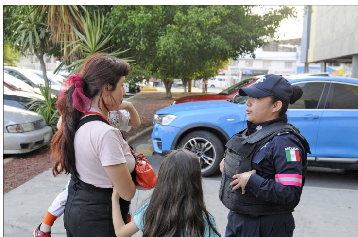
▲ Estas acciones se realizan en municipios con Alerta por Violencia de Género.

Durante el primer trimestre de 2024 disminuyeron los delitos relacionados con la violencia de género en la entidad