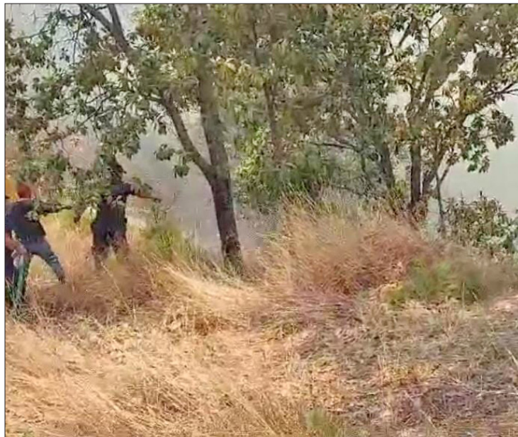
▲ En lo que va de 2024 se han atendido 870 conflagraciones.

Tan sólo este domingo, Probosque informó sobre la atención de ocho siniestros en Ejido Salitre, Santo Tomás de los Plátanos; San