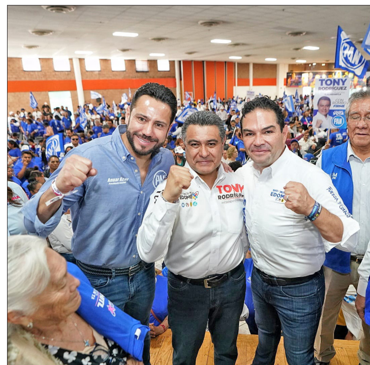
◀ En Tlalnepantla se ganarán las 5 de 5 este 2 de junio, dice el candidato al Senado.