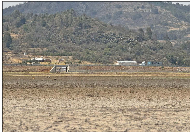
▲ En estas condiciones se encuentra la Presa Huapango.

Por otra parte, el Monitor de Sequía de México ubica a los otros 122 municipios mexiquenses, con