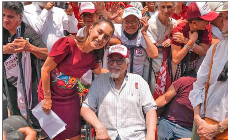
▲ La candidata en la explanada de la alcaldía de Coyoacán expresó que la gente del PRIAN es muy corrupta. Foto especial

Sheinbaum en el mitin también recordó la batalla de Puebla