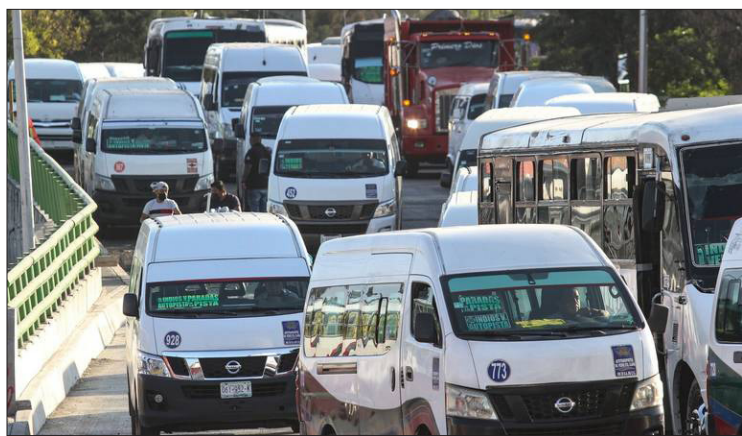
▲ La nueva Ley de Movilidad contempla el apoyo a permisionarios para la modernización de los vehículos.

Certificado de Reserva otorgado por el Instituto Nacional del Derecho de Autor: 04-2020-111712383352-101