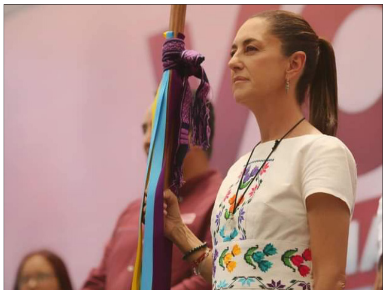
▲ Claudia Sheinbaum no descartó un posible regreso a Michoacán.

Entre sus propuestas para disminuir el peligro en el país se encuentra la “cero impunidad”