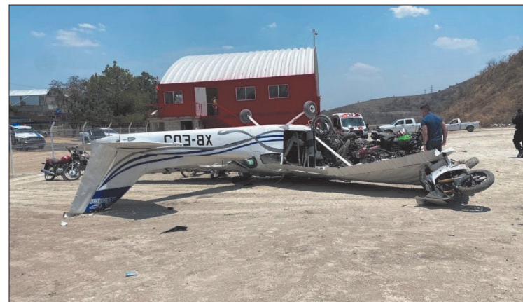
un depósito vehicular donde no había personas ni casas, lo que disminuyó el riesgo.

Al lugar arribaron la policía del Estado de México, Bomberos de Atizapán, Ejército y Protección Civil. El área fue restringida y no hubo afectación a la circulación, pues la avioneta cayó dentro de