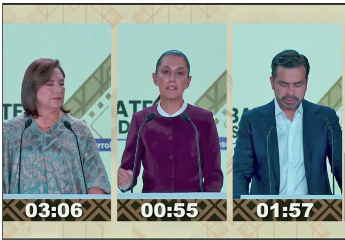
▲ Desde los Estudios Churubusco se transmitió el segundo debate presidencial. Foto especial

Xóchitl pierde tiempo en ataques; Máynez se ubica en sus propuestas y da “abollón” a la candidata del PRIAN