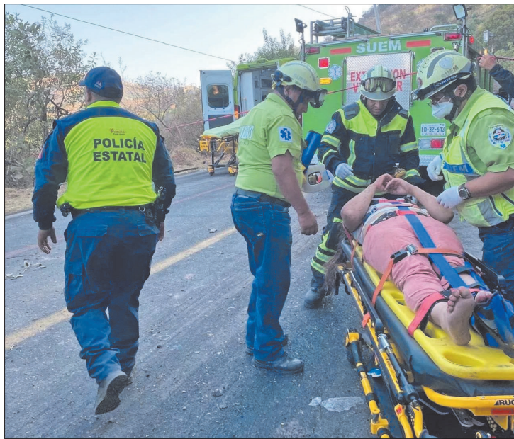
El tramo fue cerrado para realizar las labores de rescate.

El tramo de Capulín-Chalma, a la altura del Club de Golf, tuvo que ser cerrado para llevar a cabo la atención de las personas acciden-