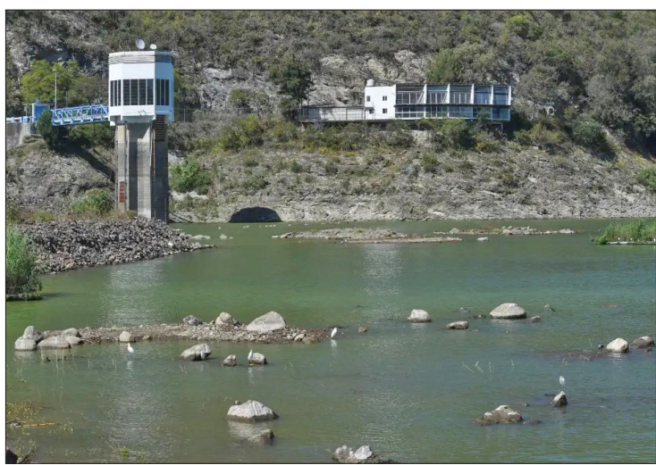
▲ Los niveles de los cuerpos de agua están por debajo del 50%. Foto especial

El año pasado, en el mismo periodo, hubo 103 municipios con algún nivel de sequía entre anor-