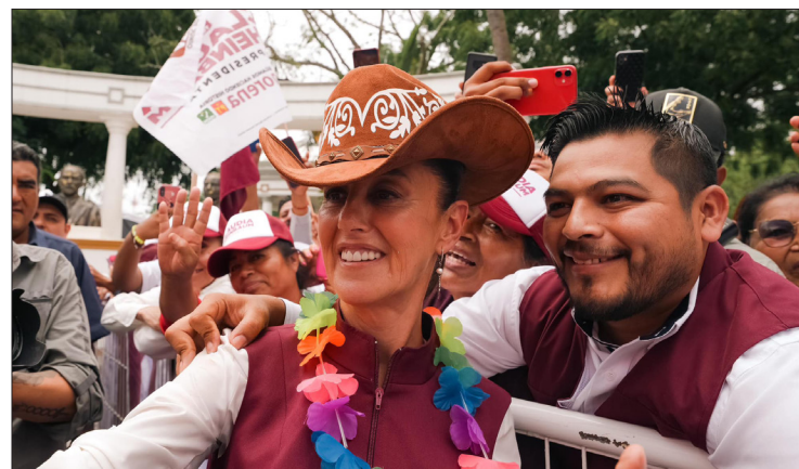
▲ La abanderada de "Sigamos Haciendo Historia" mencionó que el caso ya tiene avances.

"Lo que hemos acordado, respetando perfectamente la ley, en los cinco estados gobernados por acción nacional, va a ganar Xóchitl Gálvez como presidenta de la República", anunció Cortés.