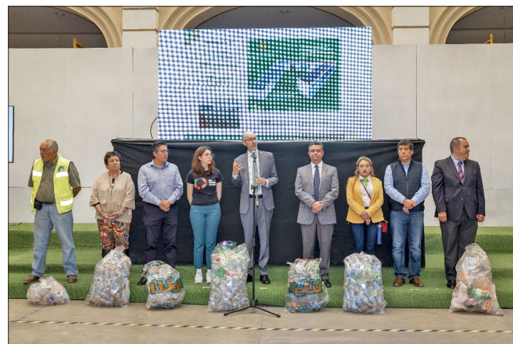
▲ Buscan fortalecer una cultura de cuidado al medio ambiente.

El porcentaje de cobertura con sequía de moderada a excepcional a nivel nacional fue de 58.17 por ciento, mayor en 1.53 por ciento a lo cuantificado a finales de febrero del presente año.