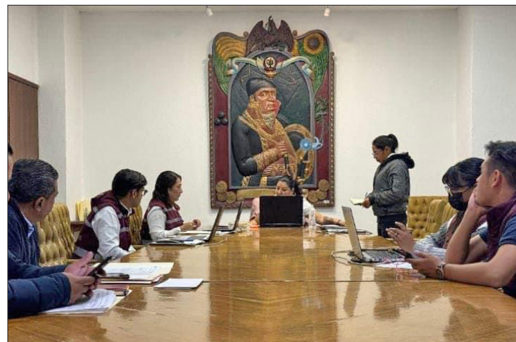
▲ El cuerpo edilicio de Ecatepec está conformado por un alcalde, dos sindicas y 12 regidores de los diferentes partidos.

Comunicaciones y Transportes por el trabajo realizado durante casi tres años, así como por su voluntad política, por aprobar por unanimidad el dictamen.