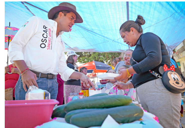
▲ Somos la mejor opción para Almoloya de Juárez, enfatizó.

En San Mateo Tlalchichilpan, comprometió mantener el Festival Internacional de la Pirotecnia, que representa una derrama económica importante para el lugar.