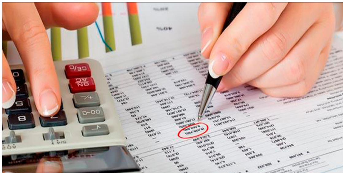
▲ Más de 800 mil contribuyentes mexicanos ya presentaron su declaración.

De ese total, 847,991 provienen del Estado de México, lo que significa el 10% de la cifra total. Quienes no realicen la acción tributaria en tiempo y forma serán multados con 18,360 pesos.