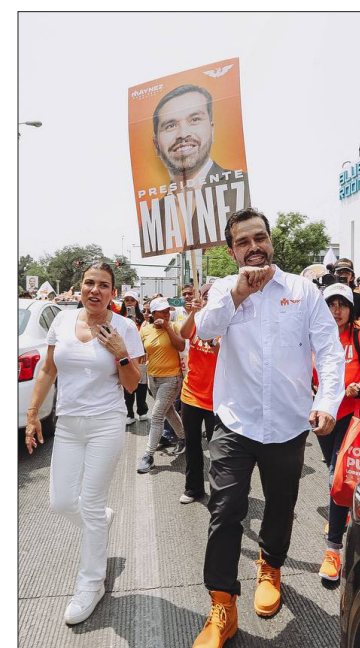
▲ El emecista se reunió con jóvenes de NL.

A pregunta expresa de si su candidatura tiene como propósito restarle votos a la candidata de la coalición Fuerza y Corazón por México, Xóchitl Gálvez Ruiz,