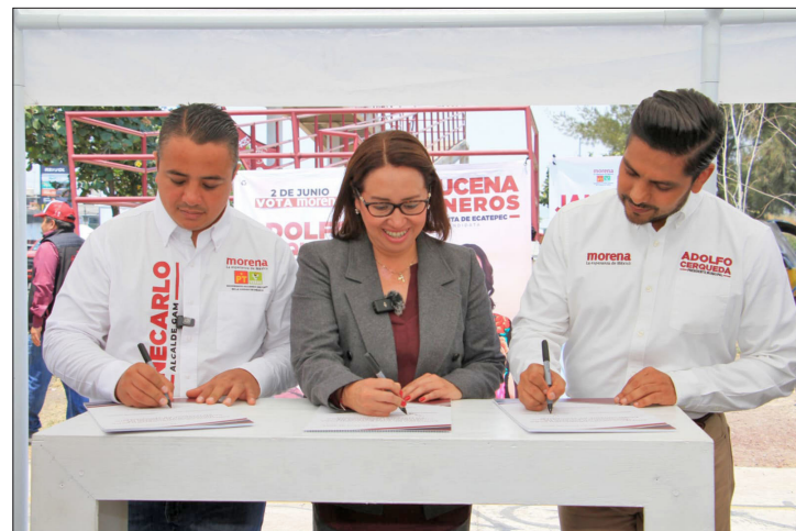
▲ Aspirantes de las tres localidades más pobladas del país buscan blindar las zonas limítrofes.