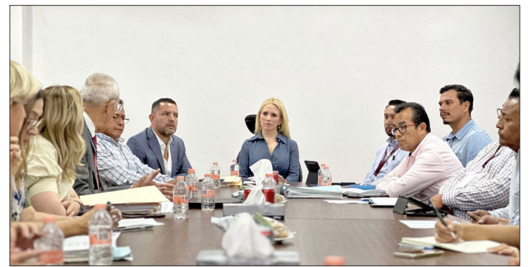
▲ Suman esfuerzos el municipio, Conagua, CAEM y vecinos.

Los adultos mayores constituyen uno de los grupos más afectados por la ola de calor debido a su menor capacidad para regular la temperatura corporal y su mayor riesgo de padecer enfermedades crónicas. Según el Instituto Nacional de Estadística y Geografía (INEGI), el Estado de México cuenta con una población de más de 1.5 millones de personas mayores de 60 años.