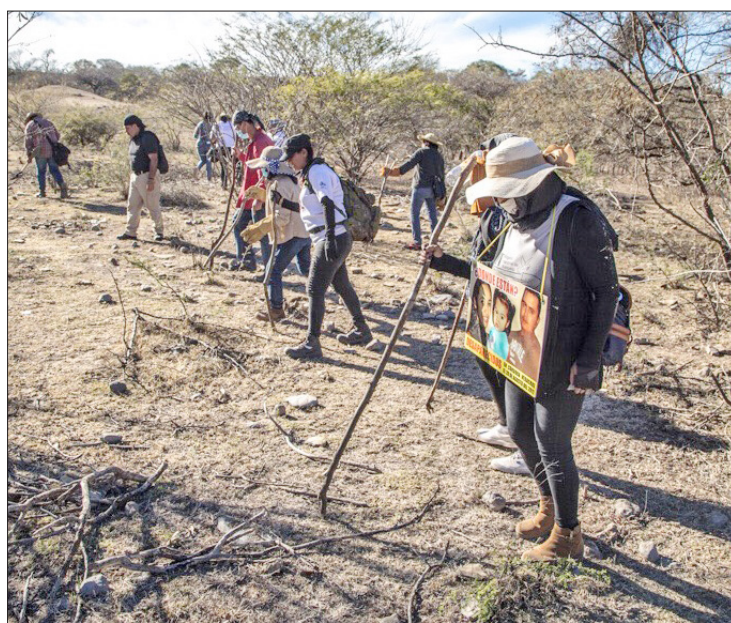
▲ Con estos recursos se apoyarán las acciones para buscar a desaparecidos. Foto especial

“Se notificará dicha transferencia a la CNBP vía correo electrónico