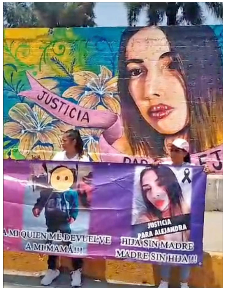
▲ La obra fue elaborada por artistas urbanos.

Actualmente el municipio cuenta con dos alertas: una por violencia de género y la otra por desaparición de mujeres y niñas.