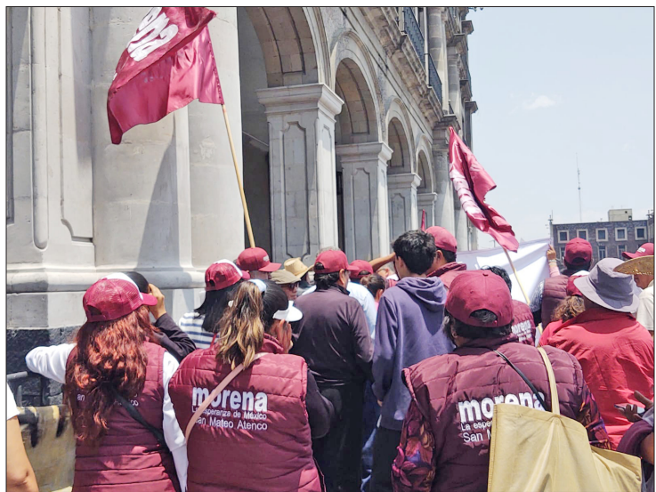
◀ Algunos militantes han expresado su malestar frente al Palacio de Gobierno.